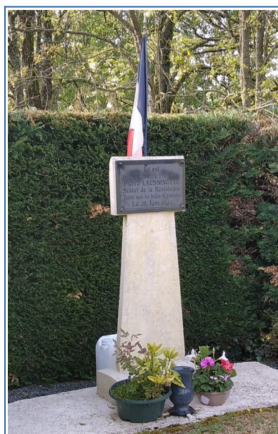
Aux Banchereaux et Place du 19 mars 1962